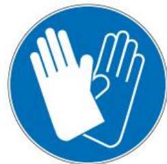
Protection des mains

Eviter de porter des bijoux Attacher les cheveux