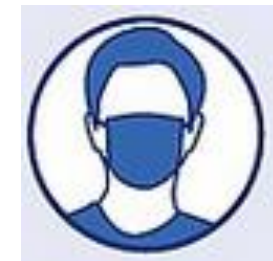
Protection de soi et des autres

Chaussures de travail ou de sécurité fermées qui restent sur le lieu de travail.