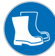
Protection des pieds

Gants jetables répondant à la norme EN 374 (protection chimique et biologique) ou des gants réutilisables lavés et désinfectés après chaque utilisation.