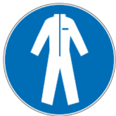
Protection du corps

Blouse de travail réutilisable propre, réservée, lavée quotidiennement.